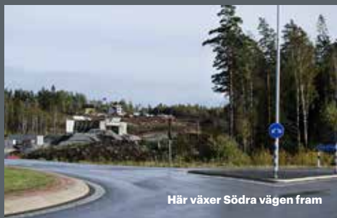
Här växer Södra vägen fram

Det pågår kontinuerligt en rad arbeten av olika slag runt om i Nässjö kommun. Det kan handla om byte av vatten- och avloppsledningar, grävning inför fjärrvärme- och fiberinstallationer, byggnation av busshållplatser, gång- och cykelvägar, av parkeringsplatser, nya gator, exploatering av industriområden med mera. En del arbeten utförs på uppdrag av Nässjö kommun, medan andra uppdrag utförs för våra egna verksamheter.