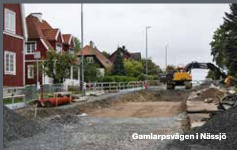
Gamlarpsvägen i Nässjö

Det pågår kontinuerligt en rad arbeten av olika slag runt om i Nässjö kommun. Det kan handla om byte av vatten- och avloppsledningar, grävning inför fjärrvärme- och fiberinstallationer, byggnation av busshållplatser, gång- och cykelvägar, av parkeringsplatser, nya gator, exploatering av industriområden med mera. En del arbeten utförs på uppdrag av Nässjö kommun, medan andra uppdrag utförs för våra egna verksamheter.