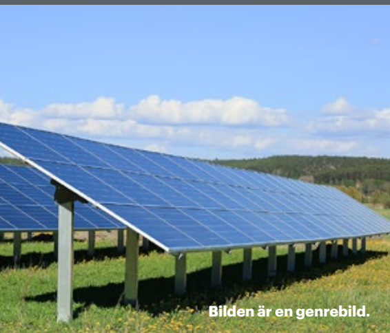
Bilden är en genrbild.