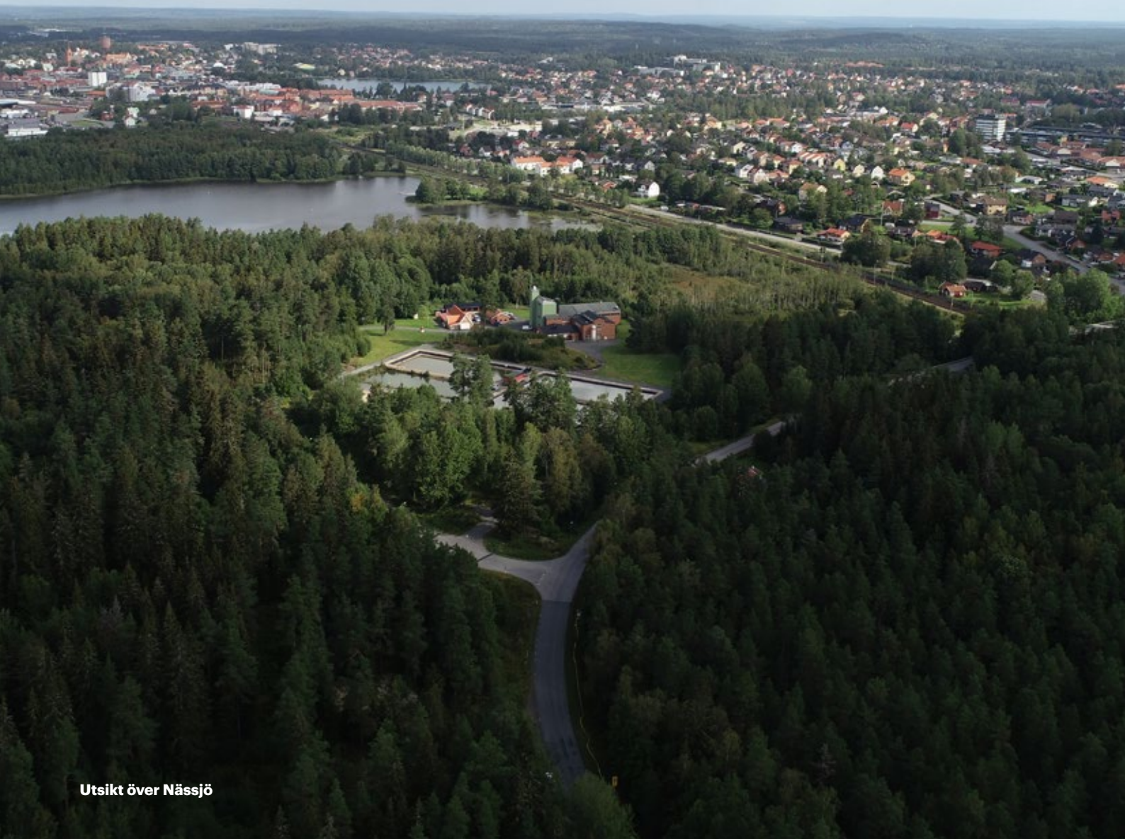
Utsikt över Nässjö