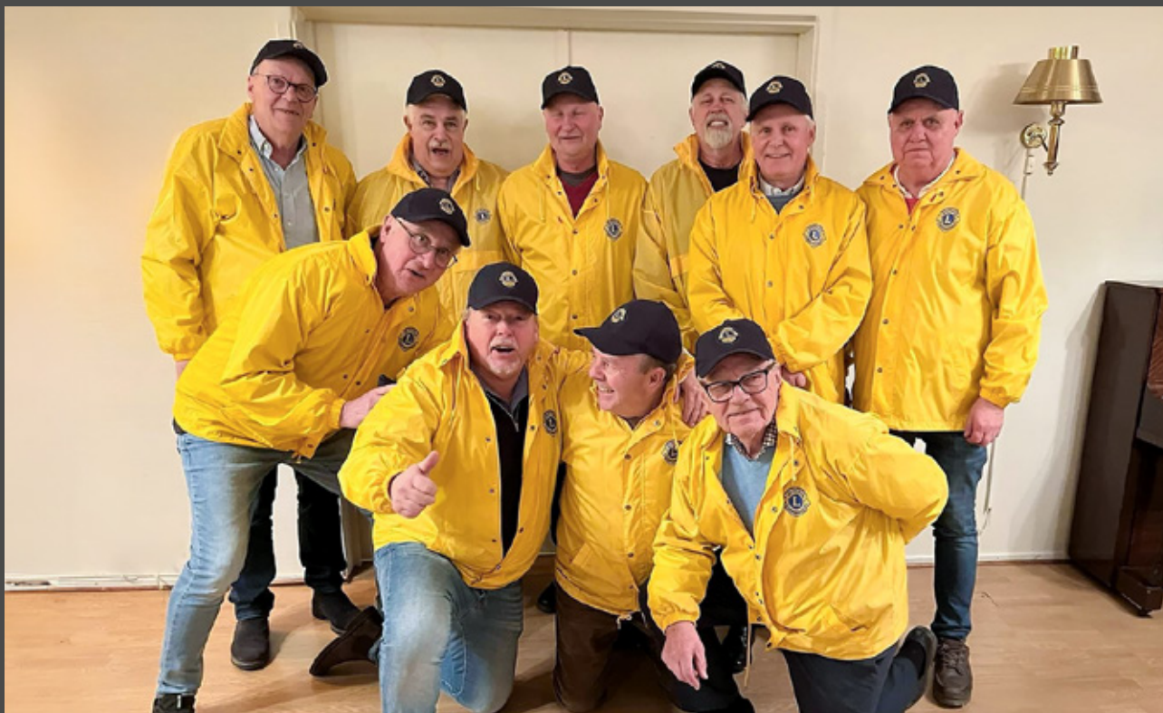
På bild "grabbarna" från Lions i Nässjö.