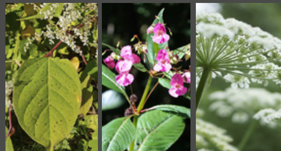
Fr.v. Parkslide, Jättebalsamin och Björnloka

Hjälp till att stoppa dessa växtarter (se bild)! En del växter vill vi absolut inte ha i våra trädgårdar, parker eller i andra miljöer. Vissa arter, så kallade invasiva, kan orsaka mycket stora skador. Gräver du i trädgården under våren? Har du en invasiv växt i din trädgård? Var försiktig när du gräver och när du ska ta hand om den! Se www.nav.se/invasiva-vaxtarter . Växterna (väl inslagna/paketerade) kan du lämna på Boda avfallsanläggning.