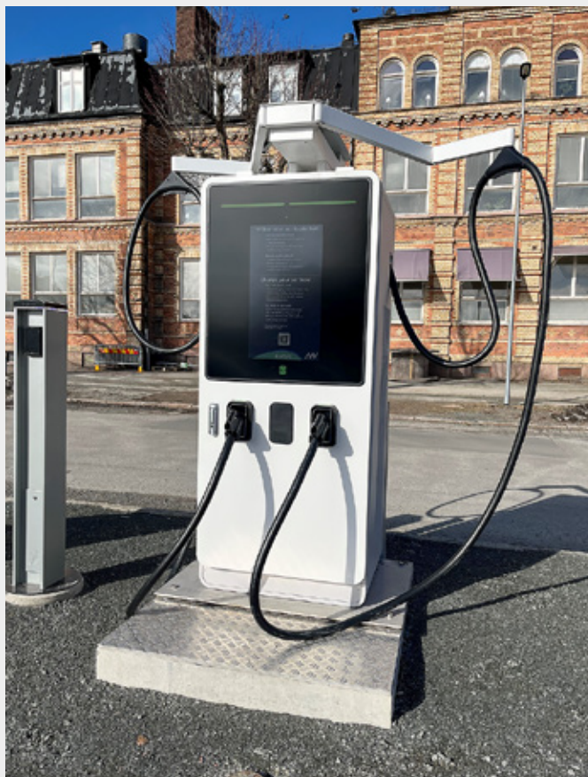
Du hittar NAVS laddare i appen Chargefinder Nässjö eller www.nav.se/ladda

Har du elbil med släpkärra eller kanske husvagn? Då passar det alldeles utmärkt att ladda din bil i Gamlarp där det finns gott om utrymme!